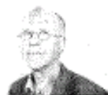
door onze correspondent Piet Jacobs