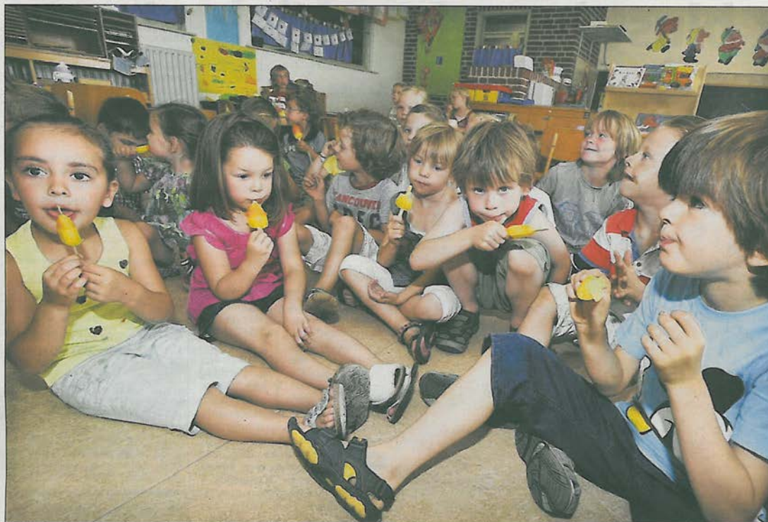
De nieuwe ‘frisse school’ werd gistermorgen voor de leerlingen vertaald in heel veel ijsjes.