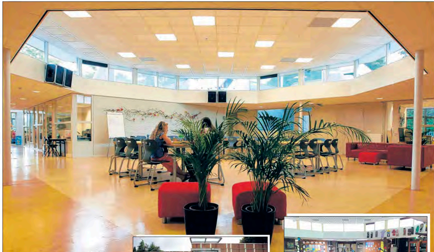
De Kuil in 't Busseltje na de renovatie is een wereld van verschil met de oude situatie.

„We hebben chirurgisch gekeken”, zegt Leistra. Veel van het oude gebouw is daardoor hergebruikt. Daardoor waren de kosten - een kleine twee miljoen euro - veel lager dan bij nieuwbouw. Het pand werd met ongeveer een derde uitgebreid. De metamorfose is in sneltreinvaart uitgevoerd om toegekende overheidssubsidies te behouden. De werkzaamheden begonnen in de zomer en het gebouw werd voor kerst opgeleverd. „Een huzarenstukje”, zegt de architect. Maandag om 14.00 uur wordt de brede school officieel geopend.